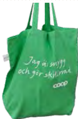
Tygkasse till Coop. Ekologisk och av Fairtrade bomull.