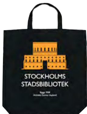
Kasse för Stockholms Stadsbibliotek. Ekologisk och av Fairtrade bomull.