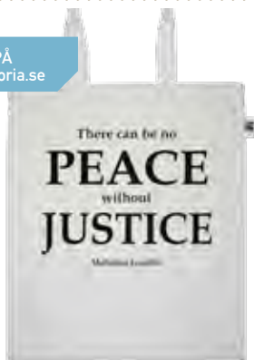
Orias egen kasse med citat från Gandhi. Ekologisk och av Fairtrade bomull.