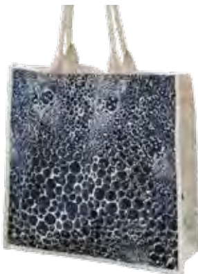
Elegant väska till House of Dagmar. Ekologisk och av Fairtrade bomull.