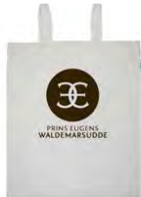
Butiken på Prins Eugen, Walderarsudde valde en tygkasse som är ekologisk och av Fairtrade bomull.