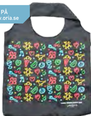
Orias egen kasse med motiv av Lasse Åberg. Gjord av återvunna petflaskor.