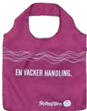
Kasse av återvunna petflaskor till Stömpilens köpcentrum i Umeå.