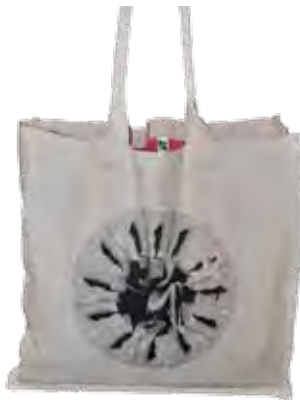
Kasse för ICA, I care. Ekologisk och av Fairtrade bomull.